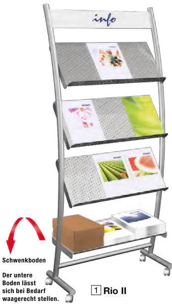
1 Rio II