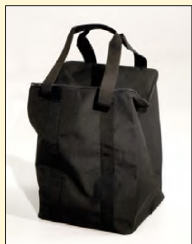
Optional: Praktische Transporttasche